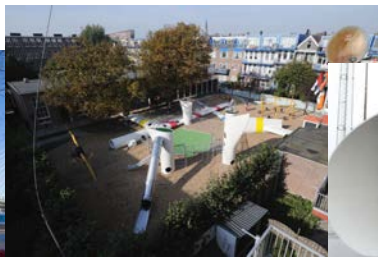
Blade Made, Dec 2014 10